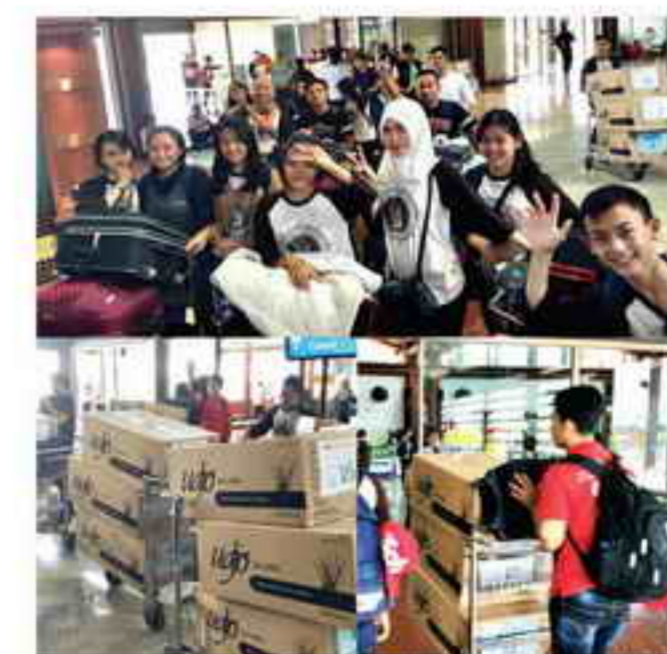
SIAP TAMPIL- Tim angklung Udjo siap tampil di Paris. Mereka akan pentas pada hari ini, Selasa (17/11).